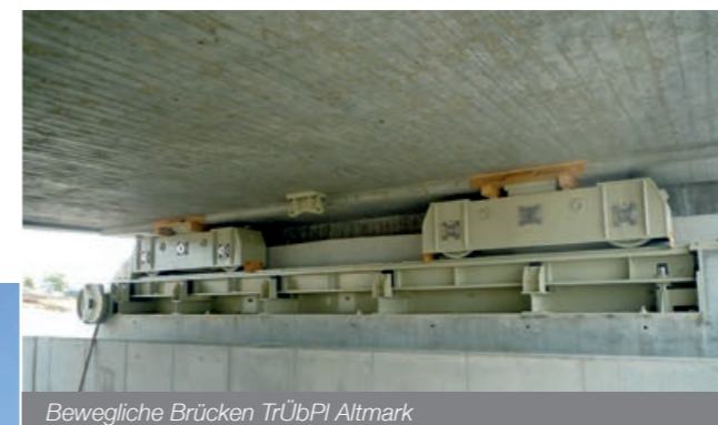
Bewegliche Brücken TrübPI Altmark

Gemeinsam werden komplexe Stahlverbundbrücken mit bis zu 6.000 t Montagegewicht im Werk Nordhausen gefertigt, auf den Baustellen montiert, eingeschoben und zum Stahlbetonverbundbauwerk komplettiert. Beim Bau von Trog- und Tunnelbauwerken in offener Bauweise werden das Know-how und die Leistungsfähigkeit der Spezialtiefbauunternehmen der BAUER Gruppe (Mutterkonzern) genutzt. Bei der Errichtung bzw. Ertüchtigung wasserwirtschaftlicher Anlagen (Talsperren, Hochwasserschutz- und Wehranlagen,