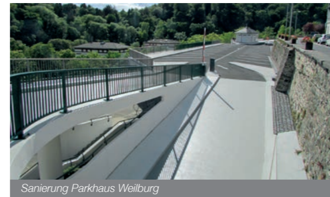
Sanierung Parkhaus Weilburg