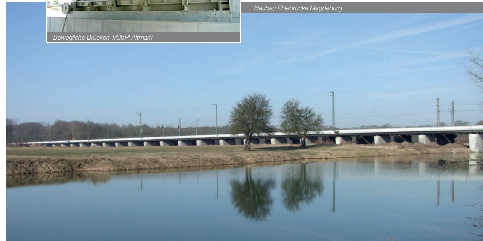
Neubau Ehlebrücke Magdeburg

Schleusen, Regenrückhaltebecken, Dükerbauwerke u. a.) erfolgt der Bezug der Stahlwasserbauteile von fachkompetenten Partnerfirmen und der Einbau in fairer Zusammenarbeit. Hohe Fachkunde unserer Mitarbeiter in Verbindung mit gewachsener Bau Erfahrung und ständiger Weiterbildung sind ein Garant für dauerhafte Bauwerke und nachhaltiges Bauen.